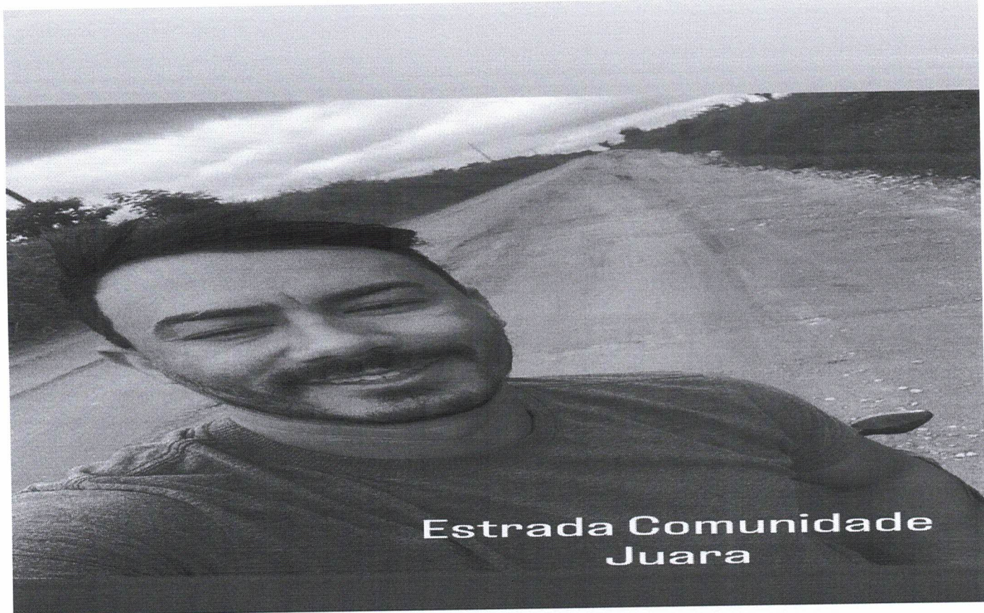
Estrada Comunidade Juara