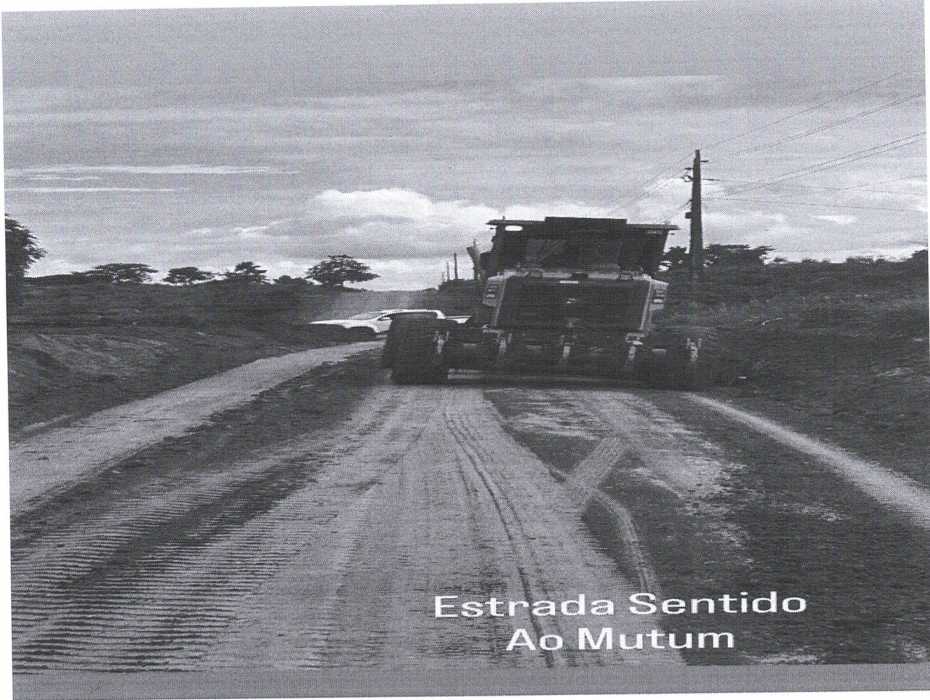
Estrada Sentido Ao Mutum