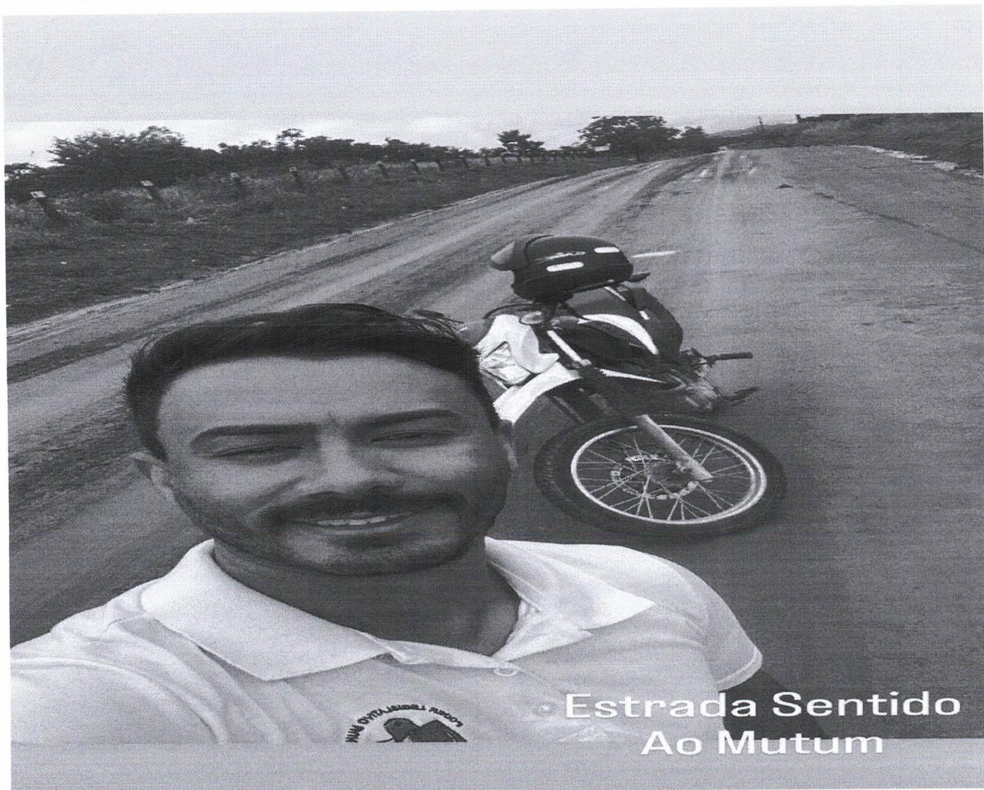
Estrada Sentido Ao Mutum