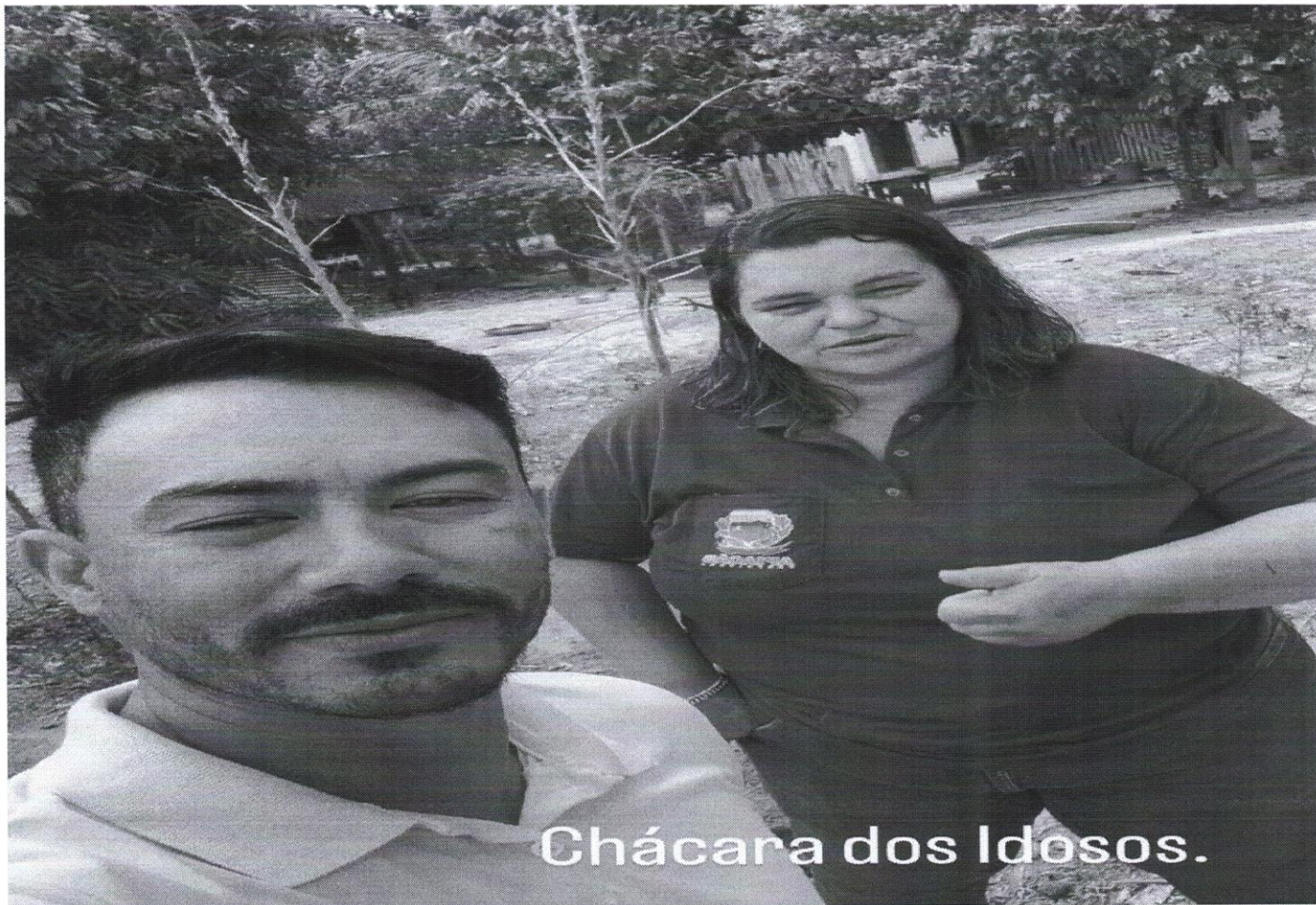
Chácara dos Idosos.