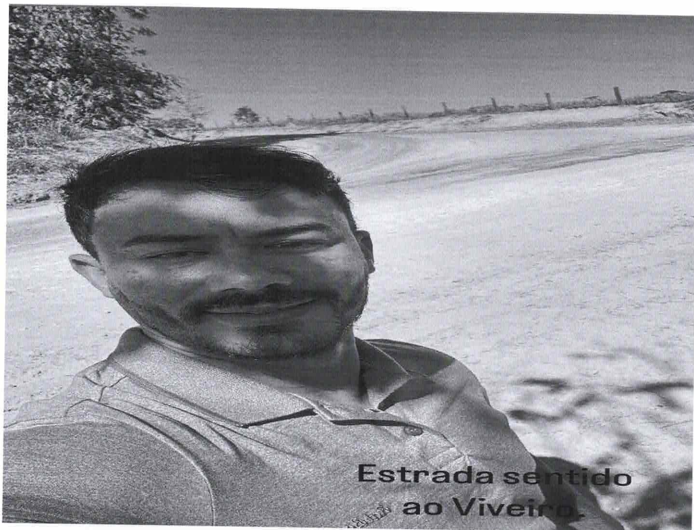
Estrada sentido ao Viveiro.