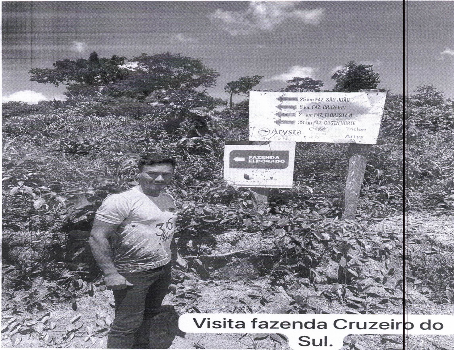
Visita fazenda Cruzeiro do Sul.