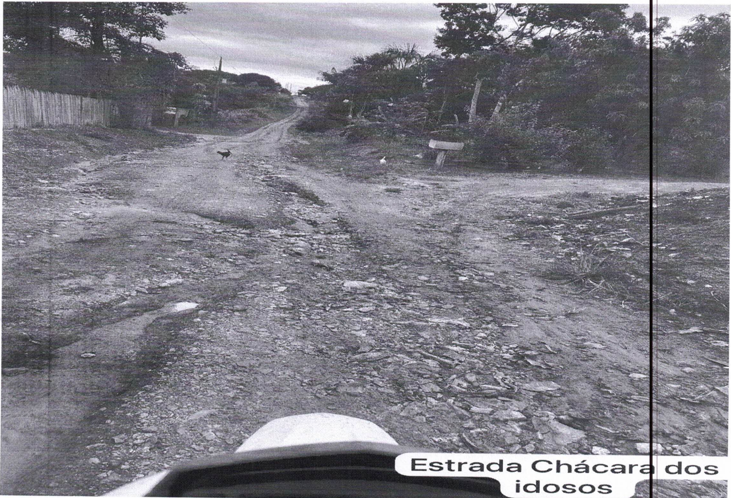
Estrada Chácara dos idosos